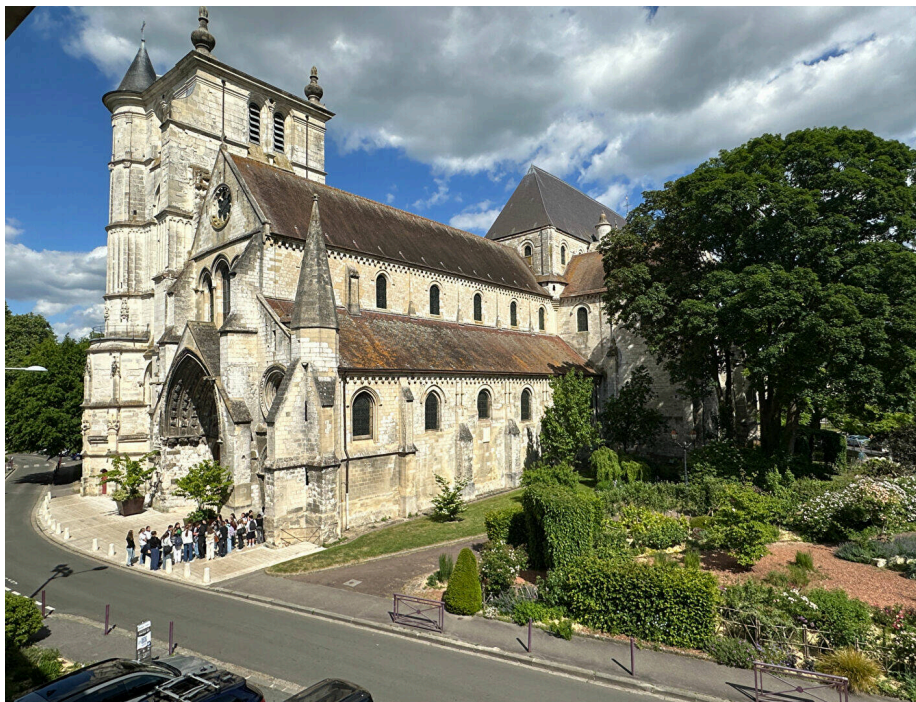
CENTRE VILLE DE BEAUVAIS, une vue à couper le souffle

Ce bel appartement situé au deuxième étage et dernier étage d'une résidence calme, offre :